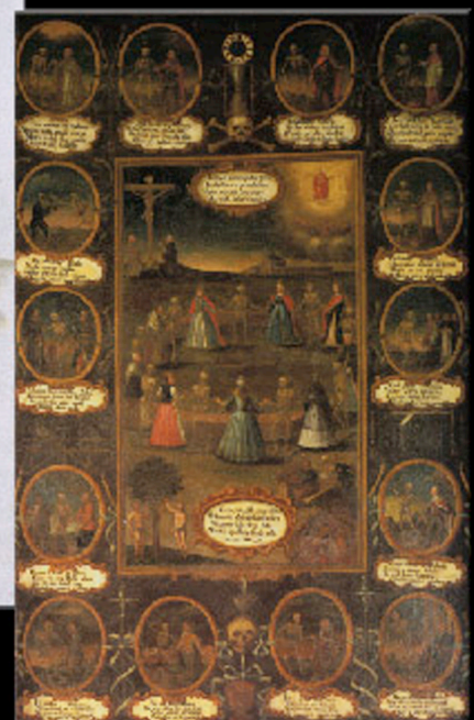
XVII c., Cracow, Church of the Bernardyni

The pharmacist in the Dance of Death has been shown already on paintings in the XV century and his lasted until the XVIII century. Then appeared the motif of a pharmacist as the assistant of the death. The skeleton appears aside the pharmacists who brings help to the people. Finally, the death itself becomes a pharmacist realizing its death-blowing medicines.