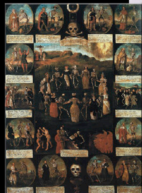
Seweryn Krauze, Dance of Death, XIX c., Poznań