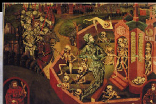
Silver Grantzlin, Knight in a Cemetery, 1492, Kolofrag