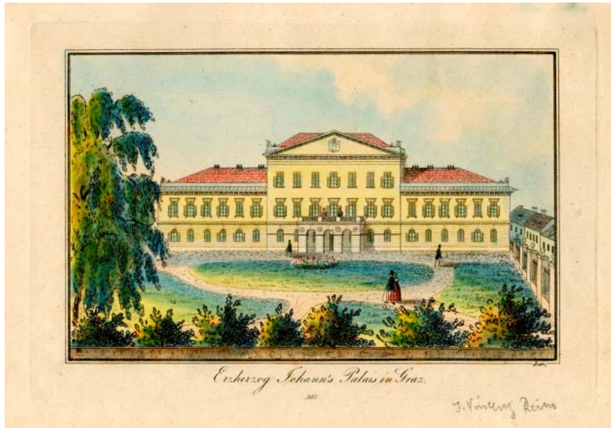
Lithographie um 1850