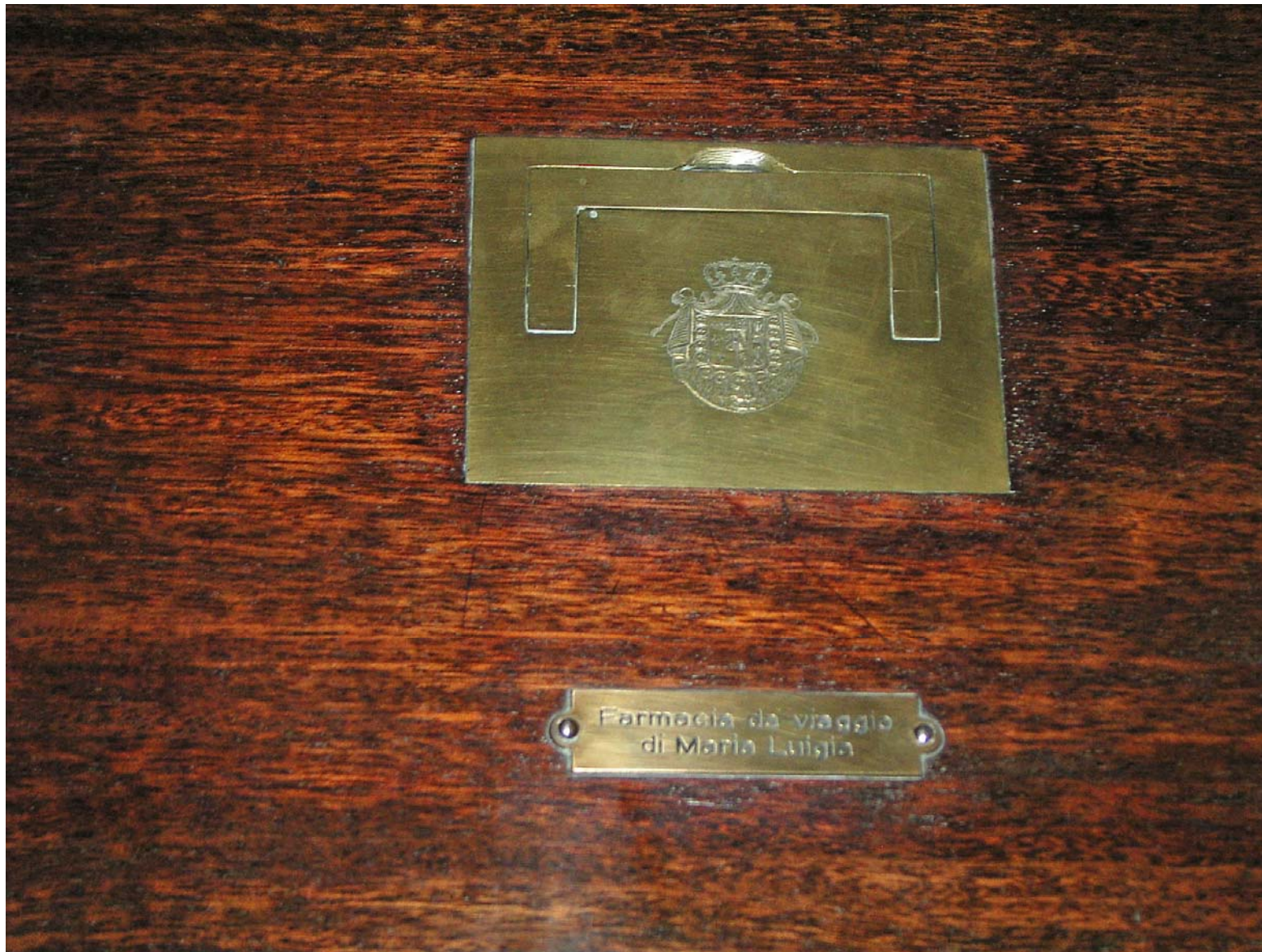
La corona ducale sulla cassetta