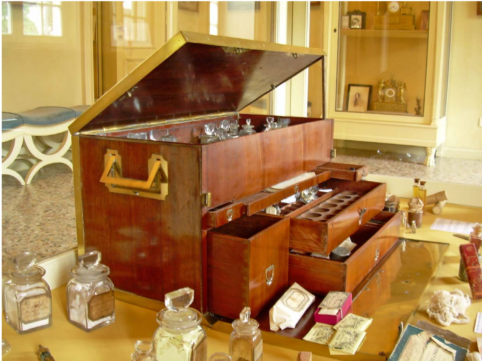
La cassetta aperta