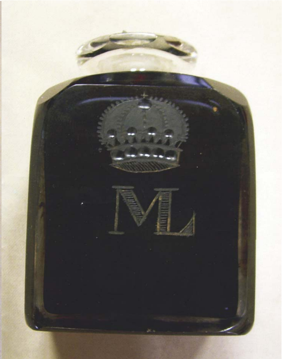
Vasi in cristallo di Boemia con la corona imperiale