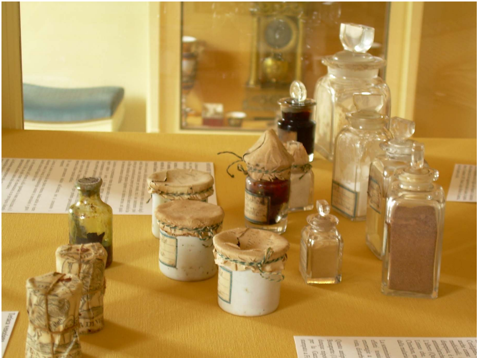
Vasetti della Teriaca Veneziana