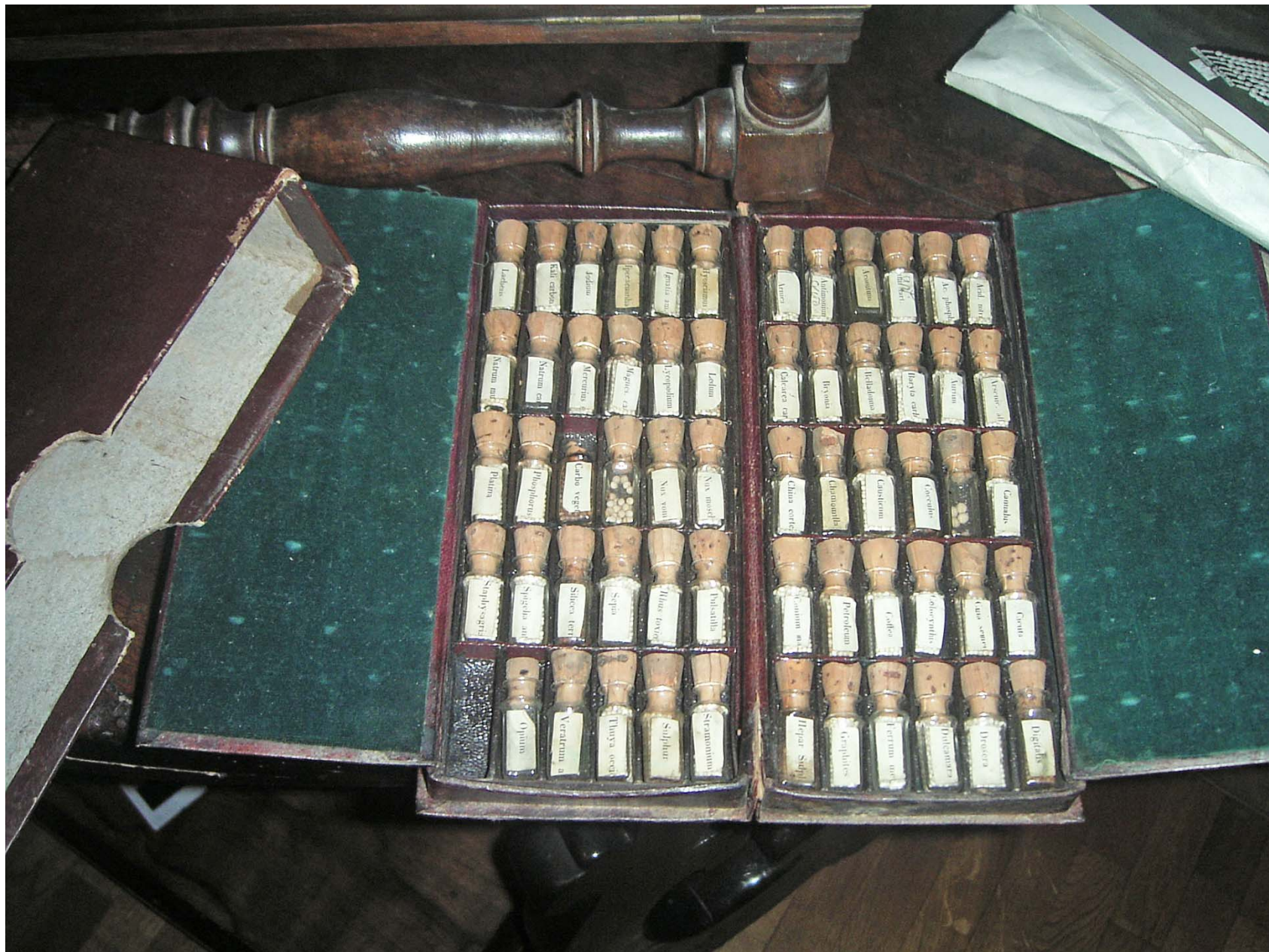
La trousse omeopatica della farmacia dei Nobili