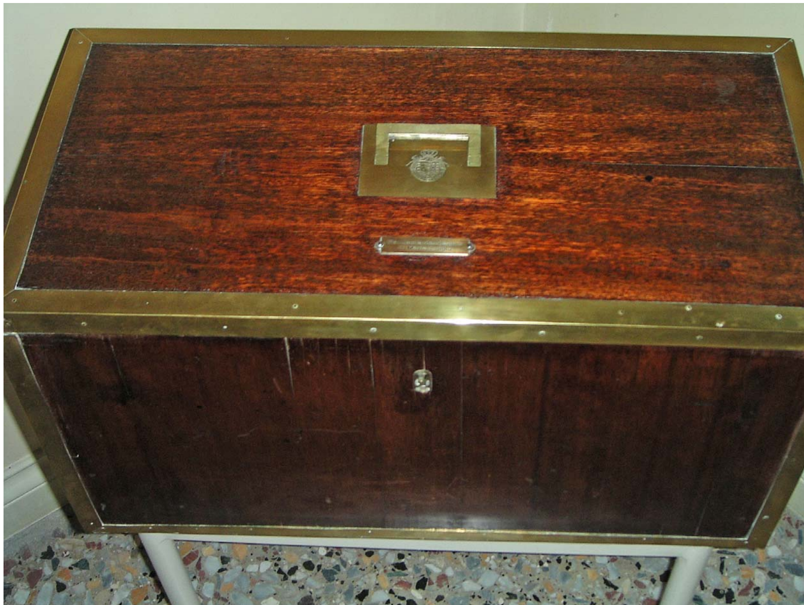
La cassetta dei medicinali chiusa