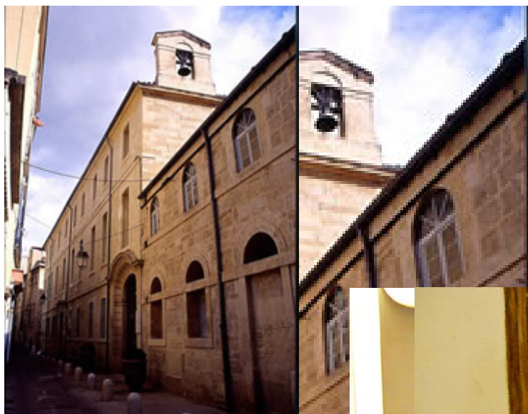
« Œuvre de la Miséricorde » in Montpellier

Miniature model of apothecary's shop made by G. Capdet, pharmacist to be seen in Musée de la Pharmacie - Montpellier