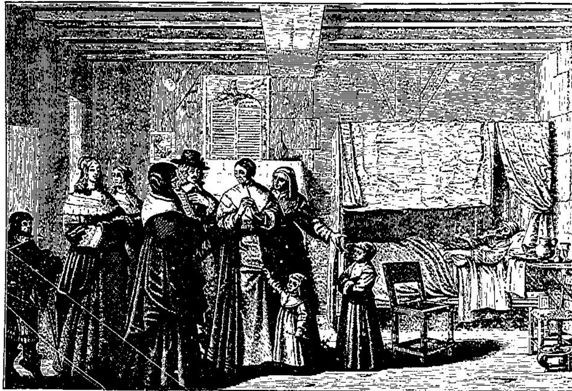
CINQUIÈME ŒUVRE DE MISÉRICORDE : VISITER LES MALADES

1668 : two sisters from the « Filles de la Charité » came to help and started the apothecary's shop